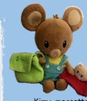
Kimy, mascotte Passerelle entre l'école et la maison