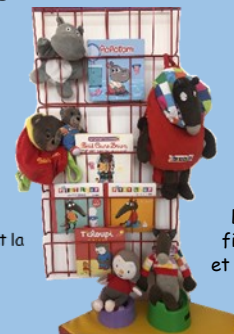
Livres, figurines et peluches